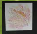
<こすり絵 (雪の結晶)>

プレイランドは未就学のお子様とその保護者を対象とした施設です。小学生以上は、 未就学児の兄弟姉妹 で未就学児及び保護者と一緒に遊ぶ場合に限りご利用いただけます。