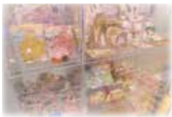
【プレイランド受付横】