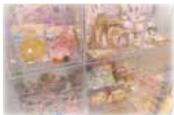
【プレイランド受付横】