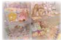
【プレイランド受付横】