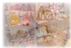
【プレイランド受付横】