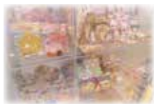
【プレイランド受付横】