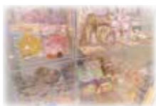
【プレイランド受付横】