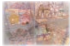
【プレイランド受付横】