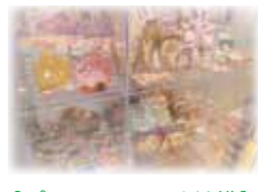
【プレイランド受付横】