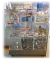
【プレイランド受付横】