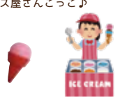
アイスクリームブロック