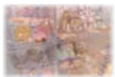
【プレイランド受付横】