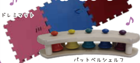
パットベルシェルフ