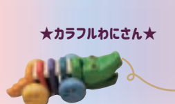
★カラフルわにさん★