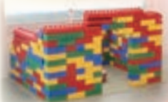
★大型レゴブロック★