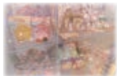
【プレイランド受付横】