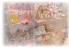
【プレイランド受付横】