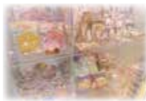
【プレイランド受付横】