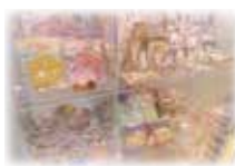
【プレイランド受付横】